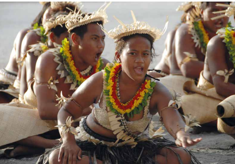
Aufführung des Sitztanzes te bino durch die Tanzgruppe Te Waa Mai Kiribati. Tarawa (Kiribati). Foto: Wolfgang Kempf, 2010.

Wie spiegeln sich in den Erwerbungen von Gegenständen die transkulturellen Begegnungen der Menschen wider, die mit den Dingen in Beziehungen standen oder noch stehen? Diese Frage bildet das Leitmotiv der Ausstellung, die Objekte aus den Sammlungen von Prof. Dr. Erhard Schlesier und Prof. Dr. Peter Fuchs zeigt.