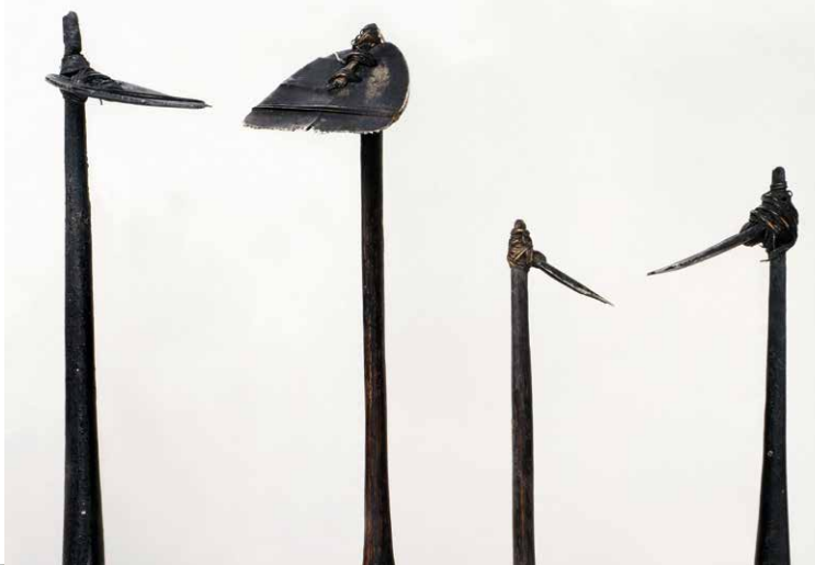
Tatauierkämme, Tahiti. Cook/Forster-Sammlung 18.Jh., Alte Sammlung 19. Jh. (Oz 435 – Oz 438).

Göttinger Ethnologinnen und Ethnologen forschen in zahlreichen Ländern Afrikas, in Südost-Asien, in Ozeanien und in Südamerika. Sie interessieren sich für die Perspektiven der dort lebenden Menschen und erweitern unser Wissen über Lebenszusammenhänge in den besuchten Kulturen und Regionen. Die Ethnologische Sammlung stellt zwei der aktuellen Forschungsprojekte aus Kiribati und Uganda vor.