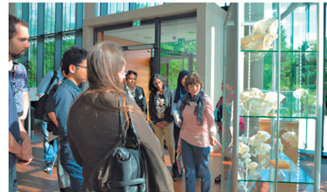
Eine Besuchergruppe bei einer Führung durch die DPZ-Ausstellung „Portraits of the Mind“ im Mai 2016.

Ausstellung eine Vortragsreihe. Einmal im Monat referieren Wissenschaftler zu unterschiedlichen Themen der Primatenforschung. Alle Vorträge werden in allgemeinverständlicher deutscher Sprache gehalten, der Eintritt ist frei.