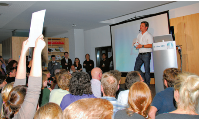
Wissenschaft in zehn Minuten: zum Abschluss der Ausstellung veranstaltet das DPZ einen Science Slam.