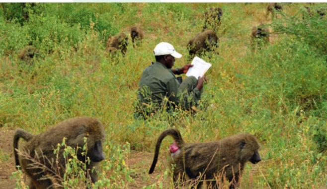
Ein Parkranger inmitten Futter suchender Anubispaviane (Papio anubis) im Lake Manyara Nationalpark, Tansania.